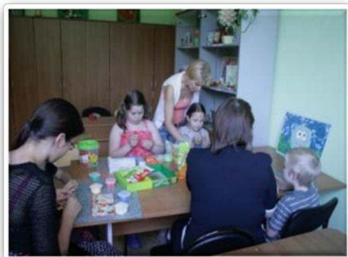
«День защиты детей»